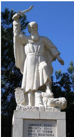
פסל אליהו בהר הכרמל

ויאמר אליהו התשבי מתשבי גלעד, אל-אחאב, חי-ה' אלהי ישראל אשר עמדתני לפניו, אם-יהיה השנים האלה טל ומטר--כי, אם-לפי דברי.