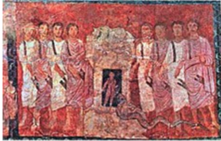
ציור מעמד הר הכרמל בדורא אירופוס

האתר משך אליו במהלך ההיסטוריה עולי רגל יהודים, מוסלמים ונוצרים. לפי עדויות שונות, שהמוקדמת שבהן היא של רבי בנימין מטודלה מאמצע המאה ה-12, עמד במקום מבנה שהנציח את המזבח שהקים אליהו.