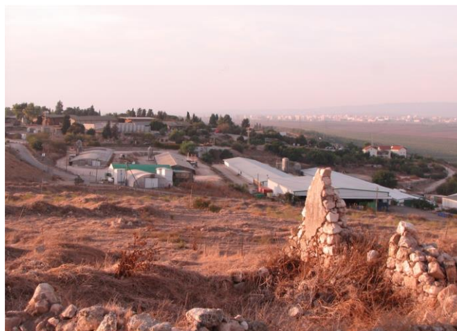
מבט מתל יזרעאל לעבר קיבוץ יזרעאל. ברקע בתי העיר עפולה

צפינו על עמק יזרעאל ממרומי קרן הכרמל ונסיים בתצפית נוספת מיזרעאל העתיקה ומהקיבוץ הסמוך.